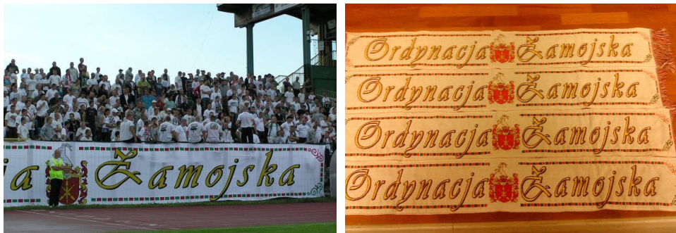
Ryc. 3. Transparent i szaliki kibiców Hetmana Zamość. Ordynacja Zamojska i jej symbole (herb Zamojskich) jako elementy budowania tożsamości kibiców

W przypadku dużej części największych posiadłości feudalnych można zauważyć rozwój silnej tożsamości lokalnej i regionalnej, częstokroć wzmacnianej odrębnościami kulturowymi. Istnienie Ordynacji Zamojskiej miało niewątpliwie istotny wpływ na ukształtowanie się silnego, obserwowanego do dziś, regionalizmu zamojskiego (Reder 1983, ryc. 3). Odrębność mieszkańców Ordynacji zauważali ich sąsiedzi, nazywając ich „Ordynatami” (podobnie jak mieszkańców Księstwa Łowickiego nazywano „Książakami”).