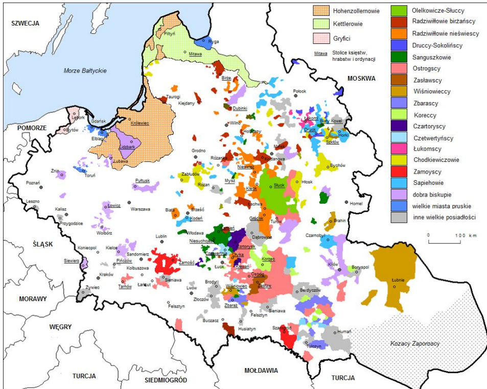
Ryc. 1. Największe posiadłości feudalne Rzeczypospolitej (bez królewskich) na przełomie XVI i XVII w.

księstwa. W ich ramach książęta mieli najwyższą władzę nad poddanymi wszystkich stanów, a więc również nad ludnością wolną: mieszczanami, szlachtą i bojarami 2 (Lubavskij 1892, 1915, Sienkiewicz 1982). Tę częściową suwerenność wewnętrzną ograniczały ogólne normy prawne obowiązujące w ramach Wielkiego Księstwa Litewskiego, które książęta (i inni wielcy panowie) musieli respektować, sprawując najwyższą władzę sądowniczą i administracyjną nad swymi poddanymi.