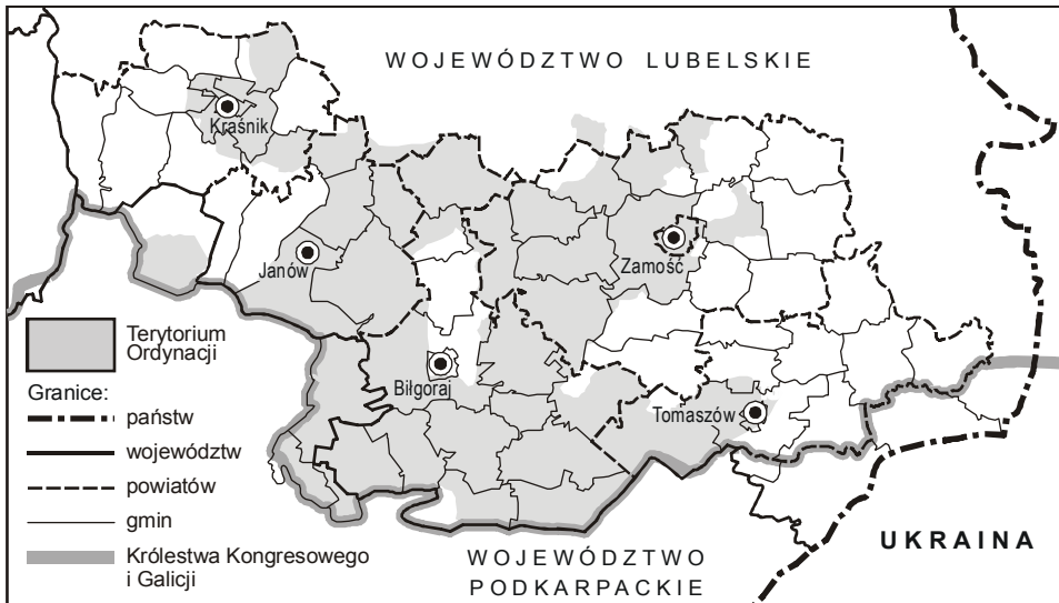
Ryc. 5. Ordynacja Zamojska jako podstawa formowania się granic państwowych (obecnie wojewódzkich), powiatów i gmin

nacji na 100 lat stała się granicą pomiędzy odrodzonym Królestwem Polskim a austriacką Galicją. Po zjednoczeniu ziem polskich trwała nadal, oddzielając jednostki terytorialne pierwszego rzędu, tj. województwa (ryc. 5).