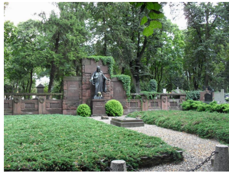
Ryc. 5. Kwaterna cmentarna rodziny Enderów

W 1852 r., w wyniku szalejącej epidemii cholery, cmentarz ten całkowicie się wypełnił, co spowodowało konieczność pozyskania nowych gruntów na cele grzebalne. Parafia ewangelicka pozyskała dodatkowe 4900 łokci ziemi (czyli ok. 2917 m 2 ) w wieczystą dzierżawę od katolickiej parafii św. Mateusza.