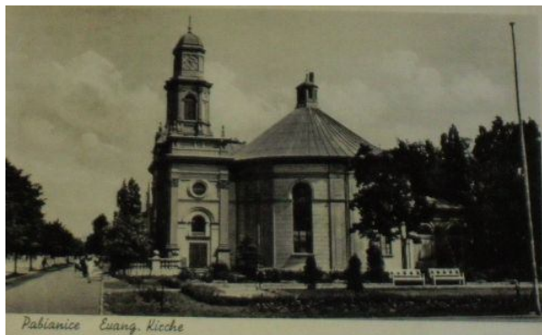
Ryc. 2. Parafia ewangelicka na pocztówce z początku XX w.

uroczyste poświęcenie świątyni. W latach 1875–1876, dzięki staraniom pastora Wilhelma Zimmera, w świątyni dokonano przebudowy, po której mogła już pomieścić blisko 1000 wiernych (ryc. 2). Dobudowano wówczas drugi chór, fronton zwieńczono figurami apostołów Piotra i Pawła (ryc. 3). Wybudowano również wieżę kościelną. W 1926 r., na 100-lecie parafii ewangelickiej, świątynia została gruntownie odrestaurowana, ponadto kościołowi ofiarowano trzy dzwony ( Parafia Ewangelicko... 2012).