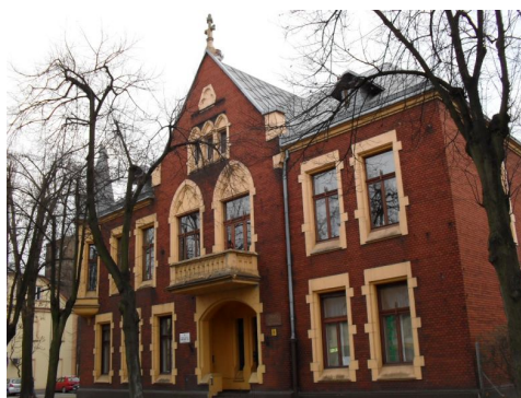
Ryc. 6. Dom parafialny przy ul. Zamkowej