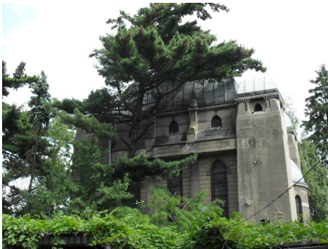
Ryc. 4. Kaplica grzebalna rodu Kindlerów