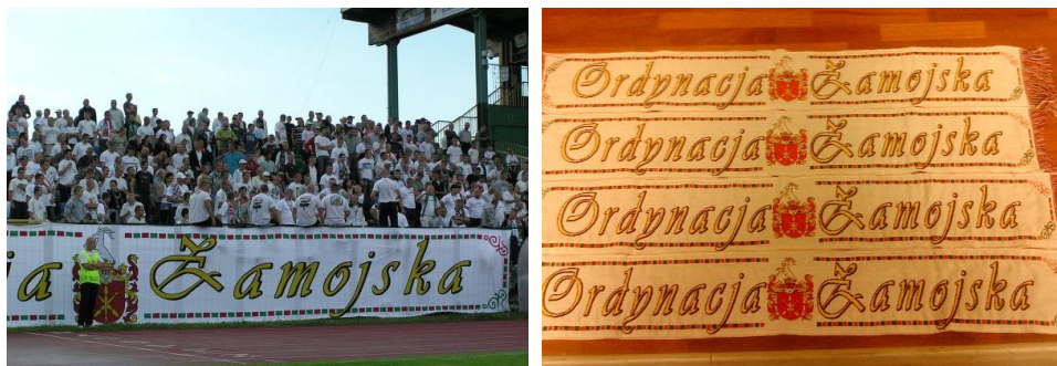
Ryc. 3. Transparent i szaliki kibiców Hetmana Zamość. Ordynacja Zamojska i jej symbole (herb Zamojskich) jako elementy budowania tożsamości kibiców

W przypadku dużej części największych posiadłości feudalnych można zauważyć rozwój silnej tożsamości lokalnej i regionalnej, częstokroć wzmacnianej odrębnościami kulturowymi. Istnienie Ordynacji Zamojskiej miało niewątpliwie istotny wpływ na ukształtowanie się silnego, obserwowanego do dziś, regionalizmu zamojskiego (Reder 1983, ryc. 3). Odrębność mieszkańców Ordynacji zauważali ich sąsiedzi, nazywając ich „Ordynatami” (podobnie jak mieszkańców Księstwa Łowickiego nazywano „Książakami”).